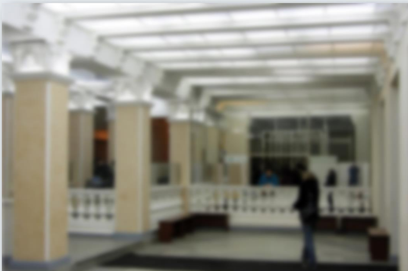
Фото 4 (Образец)

На момент проверки, представители проверяемой компании по адресу отсутствовали. Получить какую-либо информацию о материальной состоятельности контрагента не представилось возможным (Фото 4, .....)